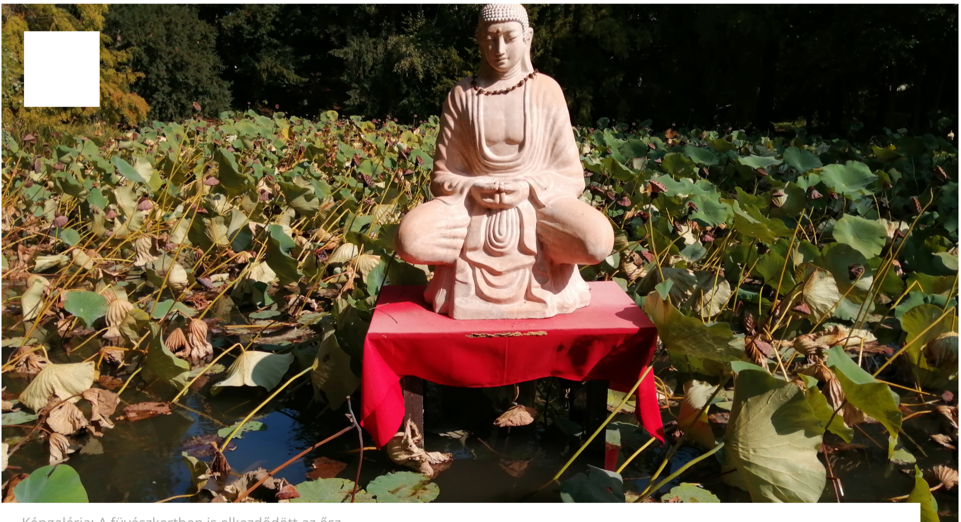
Képgaléria: A fűvészkertben is elkezdődött az ősz

Rengeteg érdekességet rejt a SZTE Fűvészkert, így nem kell városon kívülre szeretnénk kirándulni egy jót, közben élvezni a természetet is. Bár a tölgyfák szőnyegbombáznak az arra járókat és az avart, ez sem tántoríthatott el minket, hogy tegyünk egy sétát még hétfőn. Az üvegházak egyikében már a ritka szépségű Golgotavirág is megmutatta szirmait, és a Vénusz légyecsapója is rovarokra vadászik.