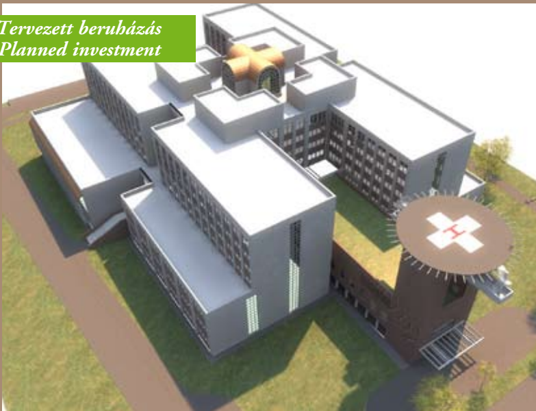
Tervezett beruházás Planned investment