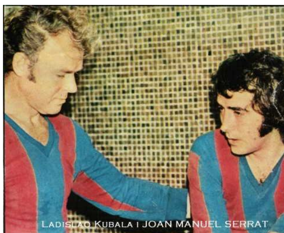
LADISLAO KUBALA I JOAN MANUEL SERRAT

EN KUBALA (1989), SERRAT NOS NARRA LA MANERA DE JUGAR DE LÁSZLÓ KUBALA. LA CANCIÓN TIENE EL RITMO DE LOS REGATES ALEGRES Y FÁCILES DEL ASTRO HÚNGARO Y SU LETRA TRANSMITE LA OPINIÓN DE TODOS AQUELLOS QUE TUVIERON LA FORTUNA DE VERLE JUGAR. EN LA FOTO APARECEN UN JOVEN SERRAT Y UN KUBALA YA RETIRADO DEL FÚTBOL, AMBOS COINCIDIERON EN UN PARTIDO DE HOMENAJE, POR ESO EL AUTOR DE LA CANCIÓN SE MUESTRA ORGULLOSO DE HABER JUGADO A SU LADO, AUNQUE FUERA SÓLO UNA VEZ.