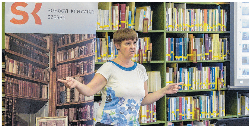
A Barbárok című novella ötlete Szegeden született meg – hangzott el az előadáson.

„Nálunk járt, rólunk is írt” – ez egy kedvelt szlogen az utókor