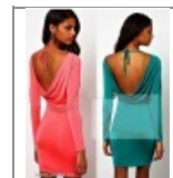
Jersey ruha L/XL