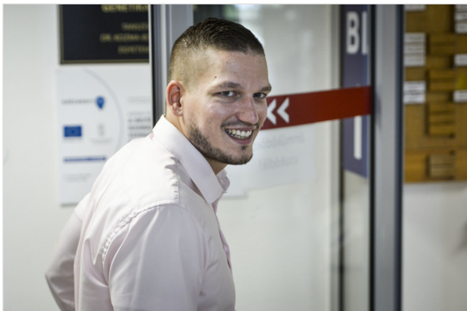
Készül a honfoglaló magyarok genomadatbázisa.

- Megjelenés előtt áll a hun, avar és honfoglalás korból származó leletek férfiágon öröklődő Y-kromoszóma-vizsgálatának eredménye. Ebben többek között kimutatjuk, hogy a honfoglalás kori leletek apai és anyai vonalai ugyanabból a régióból származtak. Azaz a férfiak és a nők együtt érkeztek a Kárpát-medencébe, ez azért jelentős, mert ezt korábban többen vitatták. Az eddigi kutatásaink alapján a szállási honfoglaló magyarság etnogenezise az eurázsiai sztyeppezonában történt, és nem a sztyeppezonától északra található erdőzónában. Ezen belül két főbb geolokalizációs pontot írtunk le: Kelet-Belső-Ázsiát és a Kaukázus lábától északra elterülő pontusi-kaszpi sztyeppe területét.