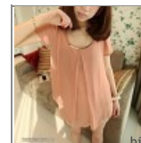
Óriás m. arany lár S