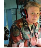
Váradiné Pás bátran buzdít mindenkit a l

CÍMOLDAL SZEGED HÍREI &gt; PIROS LESZ AZ ORR A SZIN-EN - JÓTÉKONYÁGI AKCIÓVAL KÉSZÜL A KARITÁCIÓ