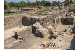
Megtalálhatták II. András király és felesége sírhelyének...