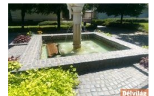
Török a facsemetét, a kaputelefont, padot - utóbbi még szökőkútba is dobják Makón

Egy jótékonyági, közös összefogásra kérik fel a Szegedi Ifjúsági Napok látogatóit a fesztivál szervezői: A SZIN pénteki napján az ország legnagyobb „piros orr flashmobját” szervezik a Borsodi Nagyszínpad előtt, ahol a piros orrot viselő látogatók a Szegedi Gyermekklinika eszközvásárlását támogatják.