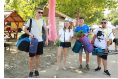
Elkezdődött a fesztivál: promóciók, játékok kavalkádja a...