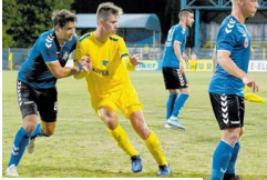
Gól nélküli búcsú Gyulától