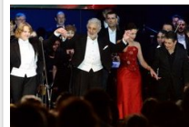
Plácido Domingo koncertjével adták át a Szent Gellért Fórumot - fotógaléria