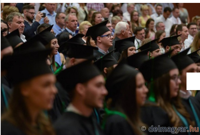
Diplomaosztó a mérnöki karon, díszpolgárt is avattak - Galéria

Az végzősök oklevelének átvétele után, a hagyományoknak megfelelően több kari kitüntetést is adományoztak. A karon folyó mérnökképzés támogatása, valamint a szegedi intézmény és más egyetemek közötti kapcsolatok kialakítása és ápolása területén szerzett kiemelkedő érdemeiért a mérnöki kar díszpolgára kitüntetett címet Latorczai János, az országgyűlés alelnöke vehette át. Latorcai tanulmányait az Esztergomi Felsőfokú Vegyipari Gépészeti Technikumban kezdte, majd 1971-ben gépészmérnöki diplomát, 1976-ban műszaki doktori címet szerzett. 1971-től a mérnöki kar jogelőd intézményének, az Élelmiszeripari Főiskola budapesti karának, később a Budapesti Műszaki Egyetemnek oktatója, itt az élelmiszeripari illetve vegyipari gépek tantárgyakat oktatta. Ennek során szakmai együttműködésben volt a szegedi kar munkatársaival is. – Abban a szerencsés helyzetben vagyok, hogy pályámat az élelmiszeripari főiskolán kezdtem, rendszeresen járok a szegedi egyetemre is, több alkalommal vettem részt elnökként záróvizsgákon. Számos jegyzetem – mechanikai és a gépészet alaptételeiről – is van, amit a hallgatók még a mai napig használnak – magyarázta lapunk kérdésére az egyetem új díszpolgára. Köszöntőjében a jövő mérnökeit néhány jó tanáccsal látta el. – A mérnök nem tud egy személyben óriásit alkotni, szüksége van mások segítségére munkájában. A mérnöki munkában tévedni lehet, de hibázni nem, mert egy emberi hiba javíthatatlan – hangsúlyozta a Magyar Országgyűlés alelnöke.