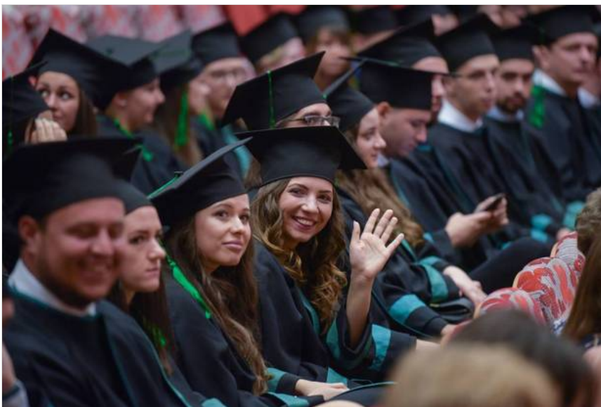
82 hallgató vehette át pénteken mérnök diplomáját a TIK-ben.