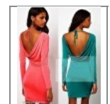
Jersey ruha L/XL