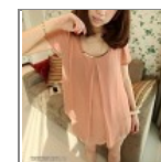
Óriás muszlinblúz arany láncsal 6337 S/M