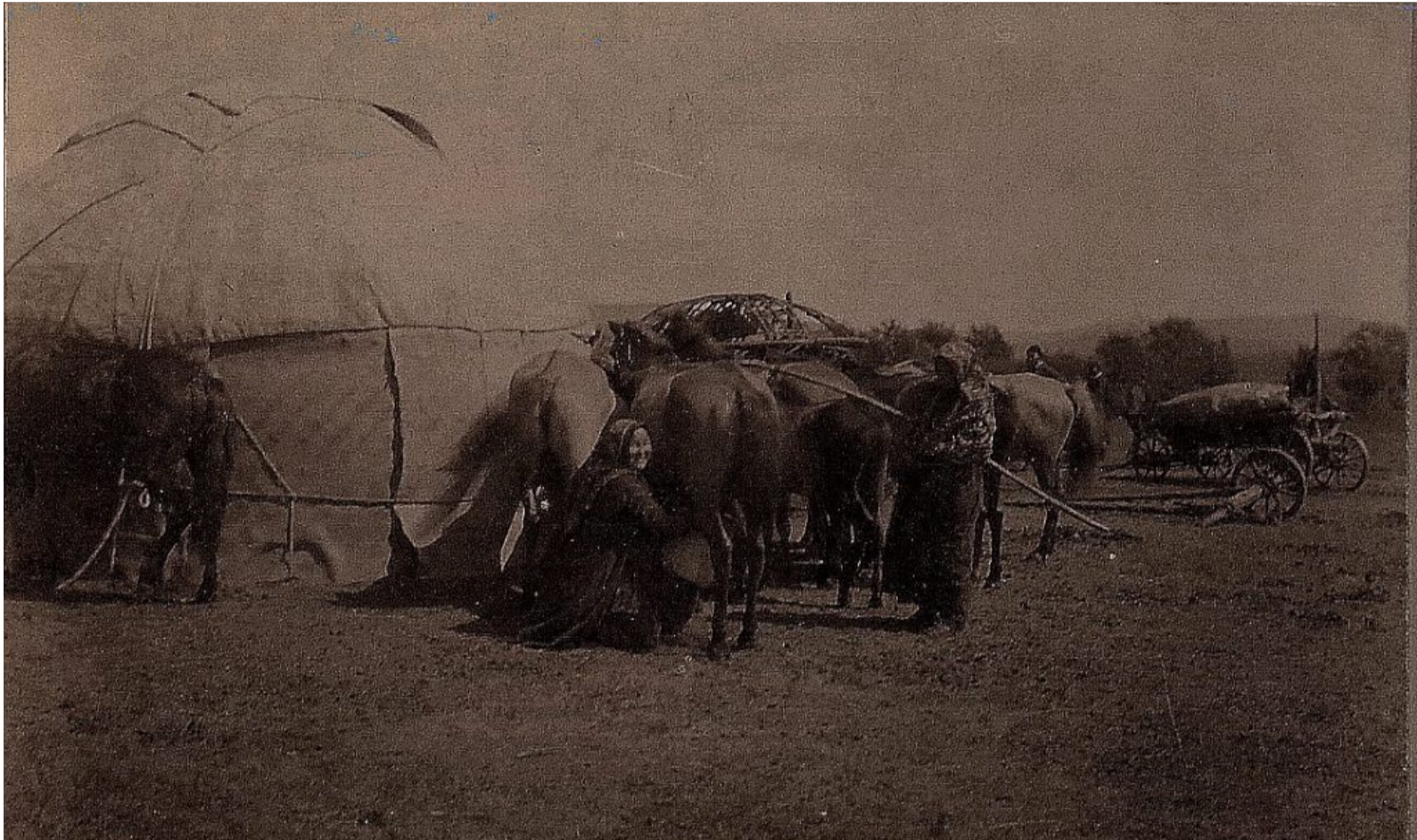
Baskír kancafejés 1908 körül

Még jobban kell majd figyelni az Intelmekben megjelenő értékekre – bátorság, erkölcsi tisztaság, önmérséklet, autonóm intézmények tisztelete, technológiai újítások iránti nyitottság –, mert szerepet játszottak a megmaradásunkban.