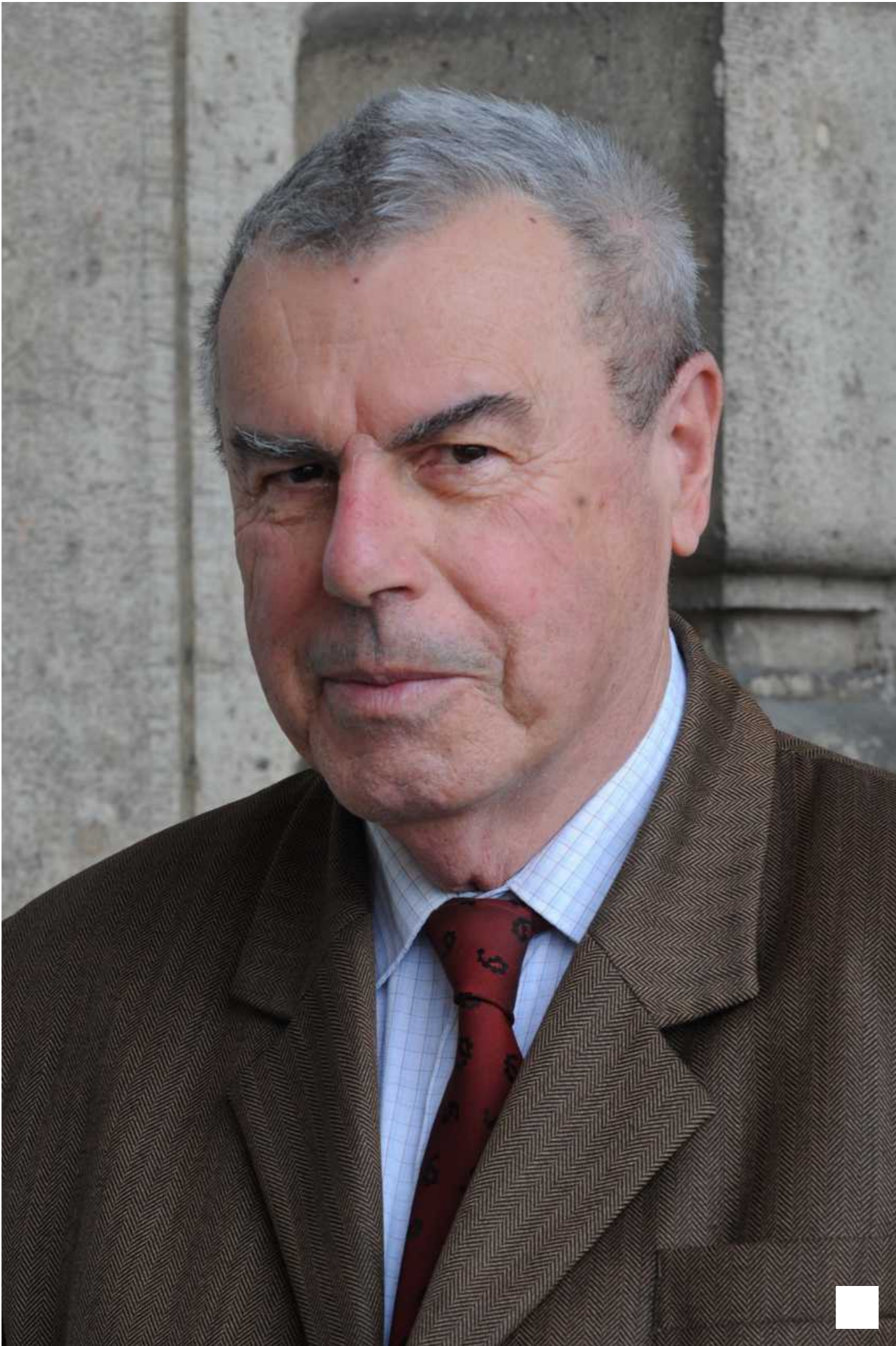
Wojtilla Gyula indológus, a Szegei Tudományegyetem professzor emeritusa

A buddhizmus kerül előtérbe az Orientalisták az OSZK-ban című sorozatunk soron következő előadásán, március 13-án. Wojtilla Gyula indológussal, a Szegei Tudományegyetem professzor emeritusával Buddháról beszélgettünk.