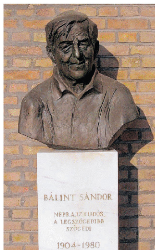
Bálint Sándor szobra a szegedi nemzeti panteonban, a Dóm téren.

Az Én másokért adatott. Az az alkotás nem lehet hiteles, amelyik emberi egyoldalúságokból, bármennyire is hangoztatott alkotói önzésből született – vallotta a 115 éve született tudós. Halálának 39. évfordulójáról a múlt 10.» hét végén emlékeztek