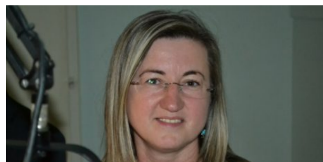
LAKOSSÁGI FÓRUM MAKÓN