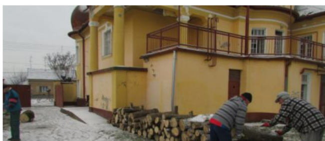
KÖZEL HÁROMSZÁZ HÁZTARTÁSON SEGÍTENEK

◀ Vásárhelyi alkotó kisjátékfilmje nyert közönségdíjat a Magyar Filmhéten