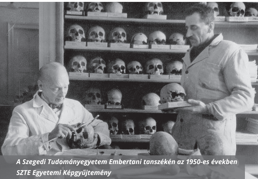
A Szegedi Tudományegyetem Embertani tanszékén az 1950-es években SZTE Egyetemi Képgyűjtemény