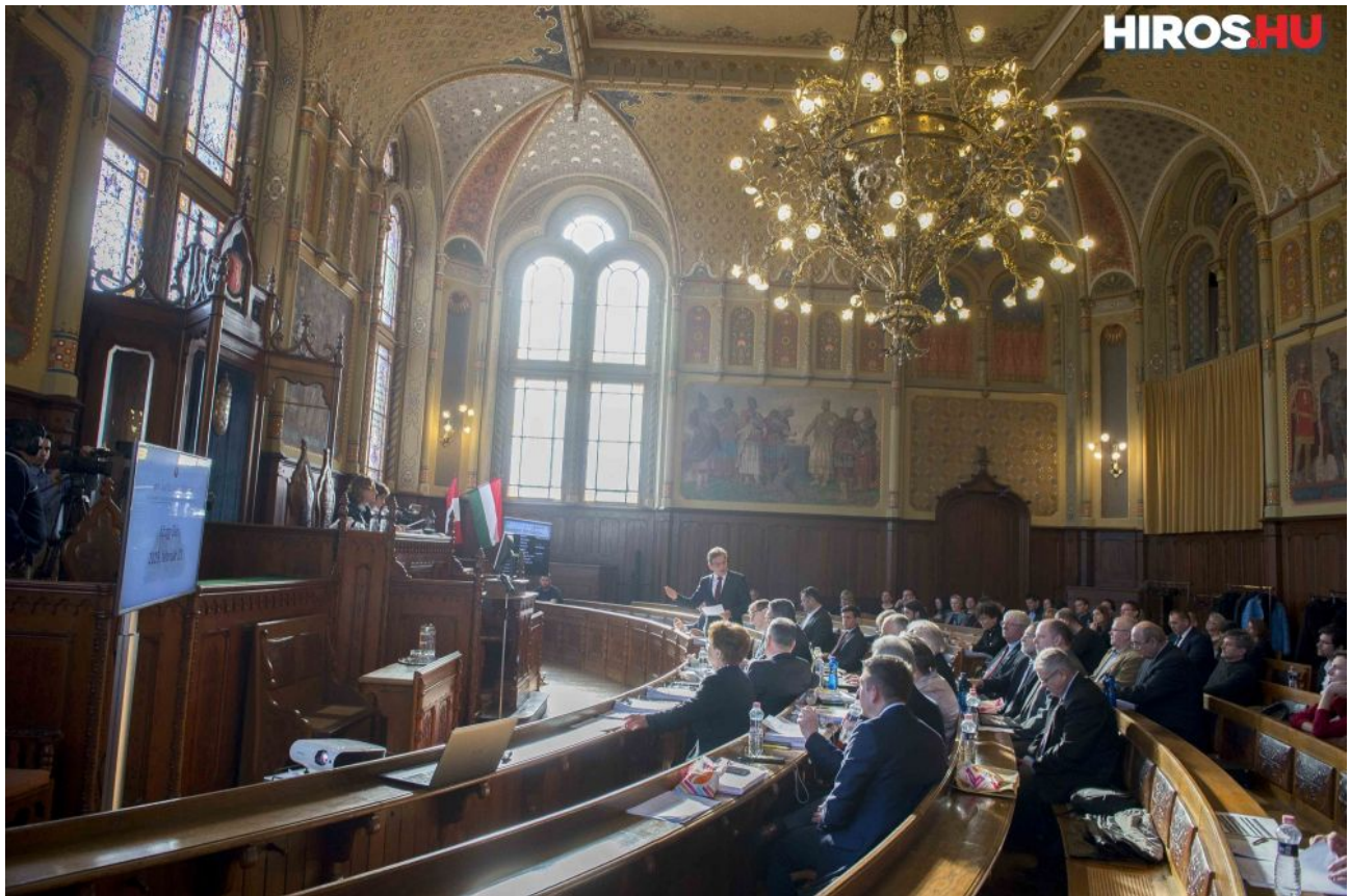
Elfogadta a közgyűlés: bővül védőnői hálózat

Az egészségügyi alapellátási körzetekről szóló önkormányzati rendeletről szavazott a képviselő testület a februári közgyűlésen csütörtök délelőtt a városházán. A témában mindössze két kérdés hangzott el, mielőtt 22 igennel a testület többsége elfogadta az előterjesztést.