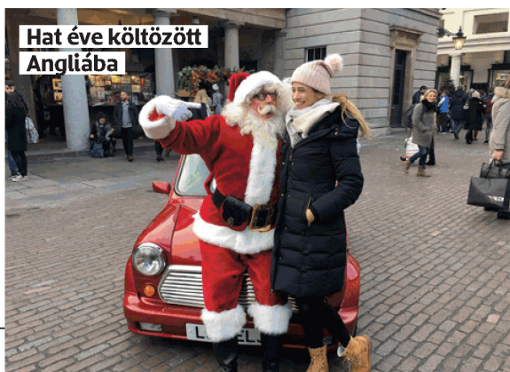
Hat éve költözött Angliába