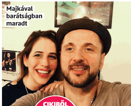
Majkával barátságban maradt