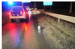
Megszólt az M3-ason elgázolt lány barátja