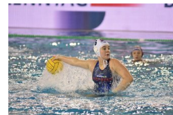
Jött a rövidzárlat a Hungerit-Sz... nál