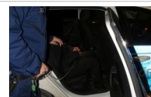
Hódmezővásárhelyi besurranó tolvajokat fogtak a rendőrök