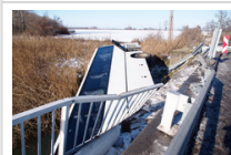
Képek a Kiskunsági-főcsatornába zuhant autóbusról