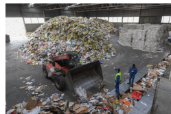
Évi 60 ezer tonna szemetet dolgoznak majd fel az új...