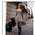
Aszimmetrikus tunika/miniruha 3 245 Ft