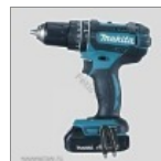
Makita DHP482RAE 18V ütvefűrő- 59 839 Ft