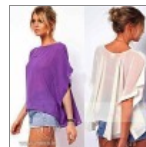
Oversized selvemblúz S/M 2 495 Ft