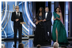
Íme, a 2019-as Golden Globe nyertesei - galéria