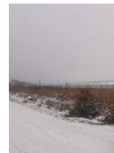
13 éves fiúk szakadt be Biatorbágy...