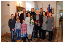
Három fiuk mellett tíz nevelt gyerekről gondoskodnak...