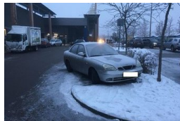
Suttyó parkolóink a hóban sem tétlenkednek