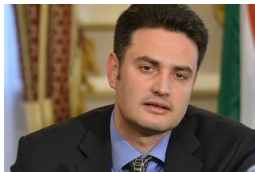
Ismét pert vettett Márki-Zay Péter - a bíróság szerint...