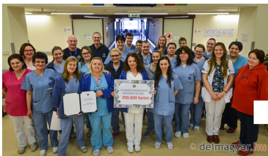
A legjobb közösségnek választották a szegedi sürgősségi szakdolgozóit az országban. - GALÉRIA