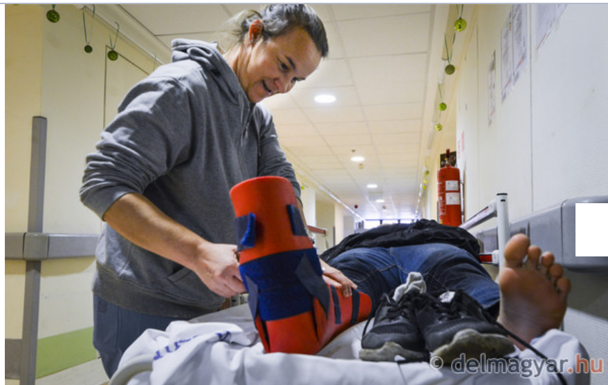
A legjobb közösségnek választották a szegedi sürgősségi szakdolgozóit az országban. Fotó: Karnok Csaba - GALÉRIA