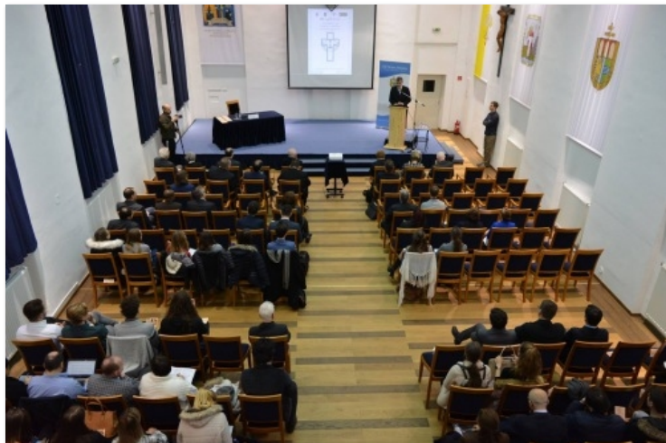
KÉPGALÉRIA – Klickezz a képre!

„Centenaria – 1918 – A hosszú 19. század vége” címmel rendeztek háromnapos jogtörténeti konferenciát december 5. és 7. között a szegedi Gál Ferenc Főiskolán.