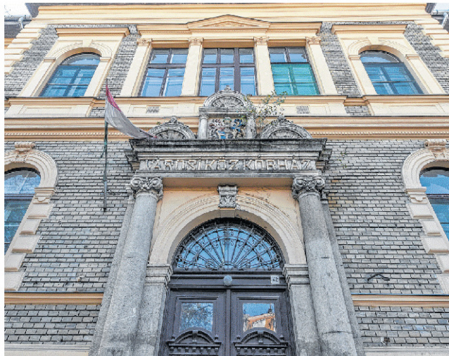
Tíz éve próbálják értékesíteni a „szellemkórházat”.