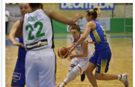
Női kosárlabda NB I - Edzőváltás Győrben az újabb vereség után