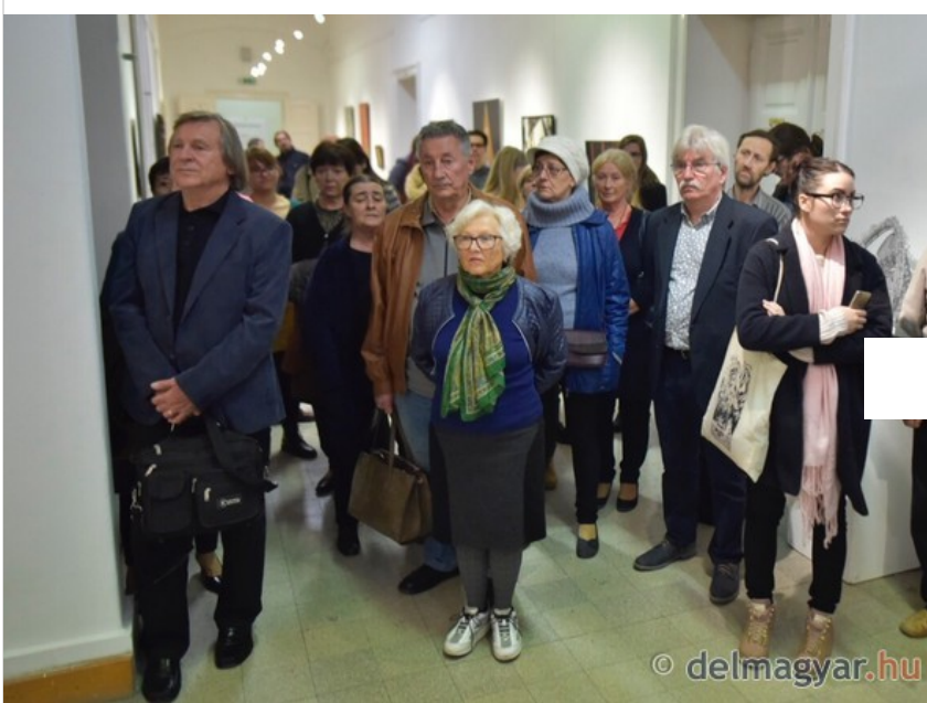
Jubileumi leltár a rajztanszéken - GALÉRIA.