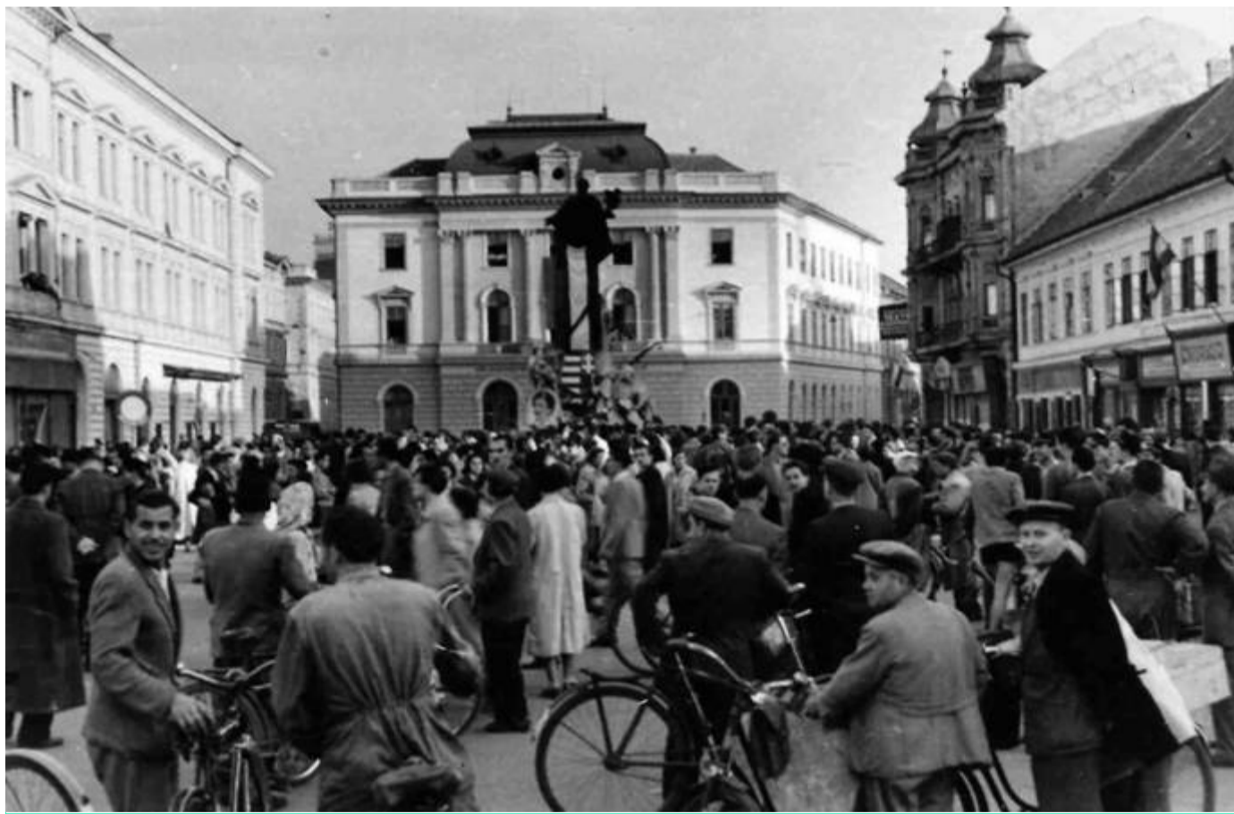
Lelkes tömeg a Klauzál téren 1956. október 25-én.

Az országban zajló tüntetések hatására, október 24-én a szegedi államhatalmi szervek megerősítették a helyi rendészeti erőket, sőt még tűzoltóságot is tömegoszlató feladatokkal bízták meg, tisztjeiket géppisztolyokkal és pisztolyokkal szerelték fel.