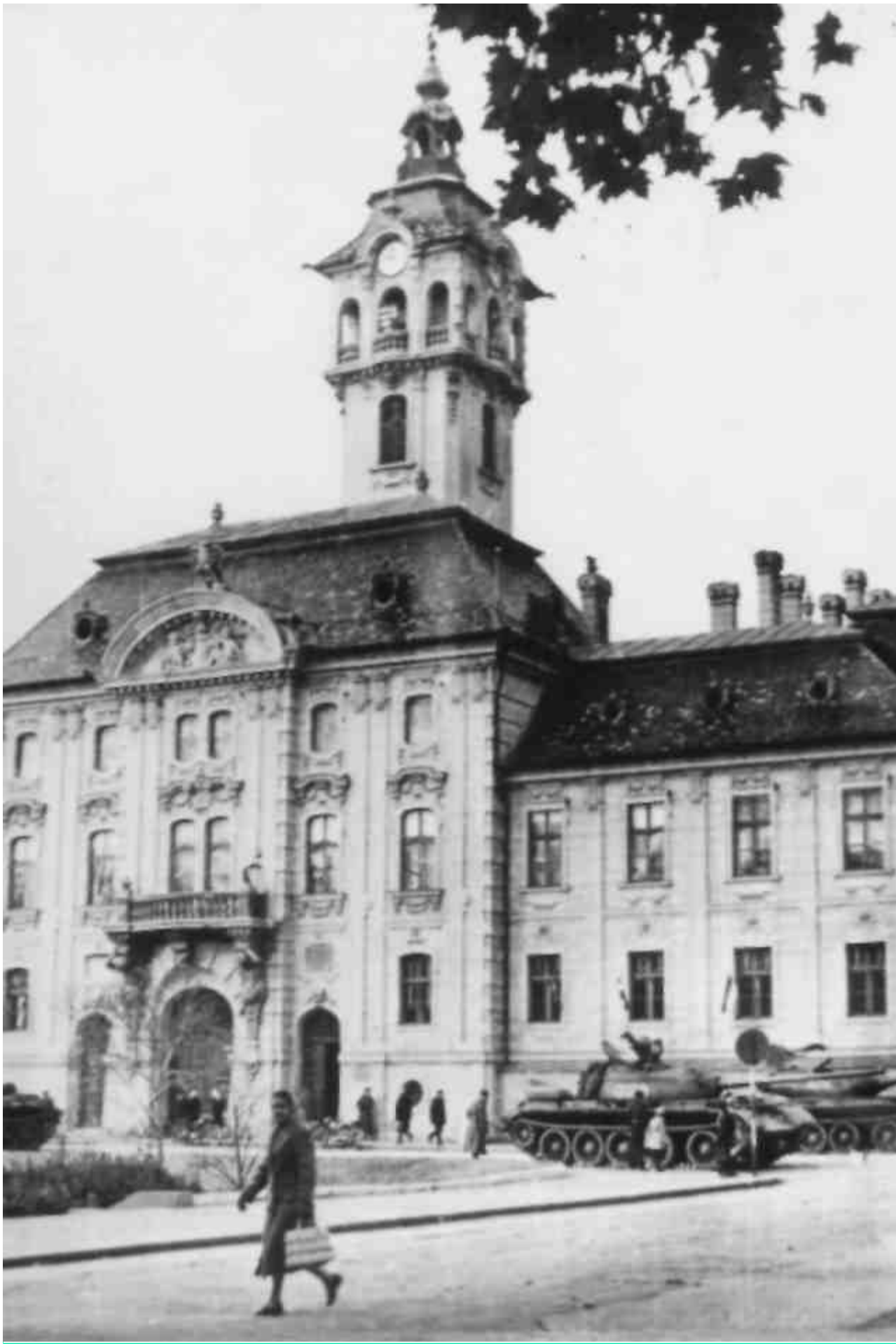
Szovjet tankok a városháza előtt 1956. november 6-án.

November 6-án, délután 3 óra körül több szovjet harckocsi behatolt a Belvárosba, körülfogta a városháza épületét, a Szegedi Forradalmi Nemzeti Bizottságot feloszlatták, tagjait letartóztattak, majd a Szovjetunióba deportáltak. Még aznap délután az orosz csapatok megszállták a város középületeit és ezzel véget ért a forradalom Szegeden.