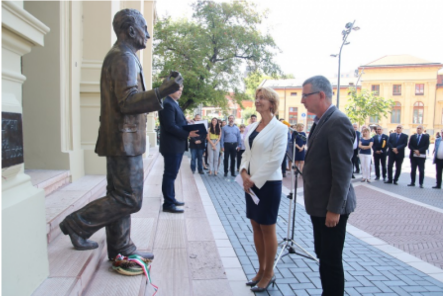
A Szent-Györgyi Albert szobra koszorúzási ünnepségén készült felvételek itt megtekinthetők ( https://www.flickr.com/photos/143739712@N04/sets/72157671357789917 )

Olyan gazdag Szent-Györgyi Albert életműve és oly összetett személyisége, hogy szinte minden esztendőben és több hónapban is találhatnánk egy-egy olyan napot, amikor valamiféle évforduló szolgáltat apropót a vele kapcsolatos megemlékezésre, tisztelgésre. 2018. szeptember 16-án arra emlékezhettünk, hogy 125 évvel ezelőtt született az a magyar Nobel-díjas orvos és biofizikus, aki a tudományos élet e legrangosabb elismerését jórészt a szegedi egyetemen végzett kutatásaiért kapta. De idén szeptemberben arra is visszagondolhatunk, hogy Szent-Györgyi Albert mikor járt először Szegeden? Mikor és kinek a társaságában láthatta azt a Dugonics téri épületet is, amely ma a hazánk egyik legrangosabb felsőoktatási intézménye és kutatóhelye, a Szegedi Tudományegyetem központi épülete?