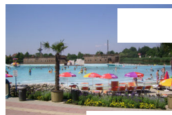
Megpapucs és a is: a strandc