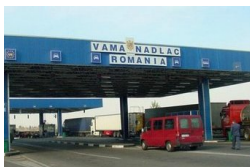
53 migránst találtak Nagylaknál egy mézet szállító...