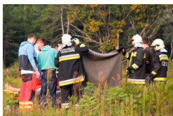
Súlyos baleset történt Ásotthalom közelében