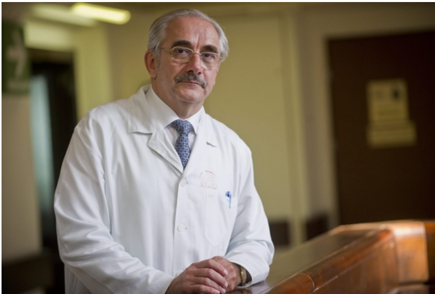
Vécsei László