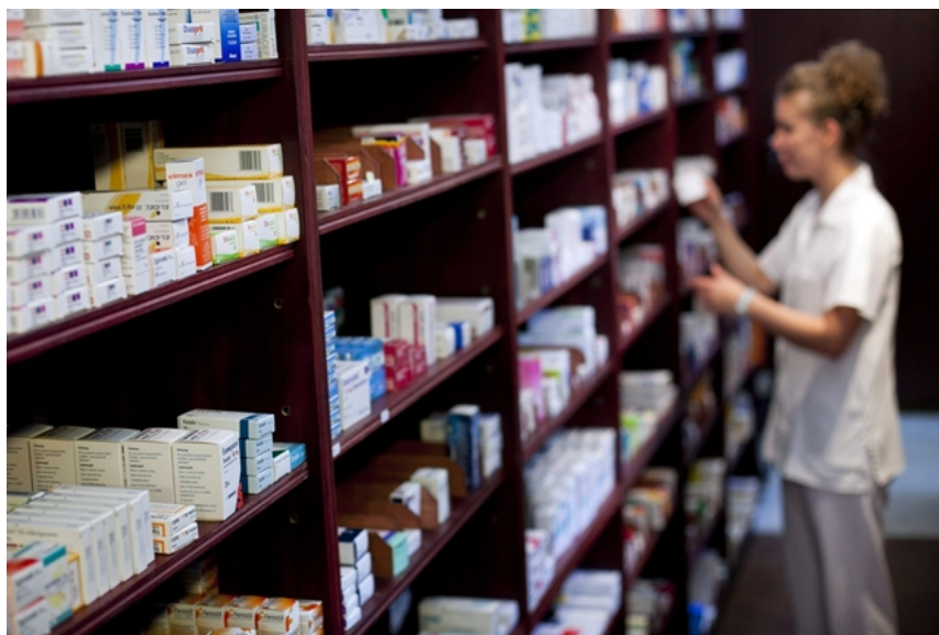
Képünk illusztráció

A migrén, tapasztalatom szerint, olyan dolog, amit az utolsó órákban már abból a szilárd meggyőződésből fakadó, időnként sírással kísért, kétségbeesés jellemez, hogy ez már soha, de soha nem fog elmúlni. Az ember a gyógyszerek mellett – a sötét szoba hűvösétől kezdve a jegelésen és a sok folyadék fogyasztásán át a nyakat masszírozó irányított vízszugárig – mindent kipróbál, hogy a tüneteket enyhítse, de ezek a házi praktikák valójában csak éppen annyi enyhülést hoznak, hogy valahogy túléljük a napot, megoldást a hétköznapi fejfájás kezeléséhez képest nem nyújtanak.