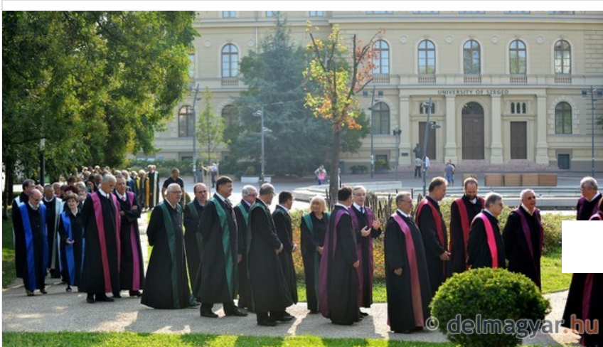
Így vonultak az SZTE szenátus tagok a tanévnyitóra. (Galéria)

-mondta el a szombati ünnepélyes megnyitón az intézmény új rektora.