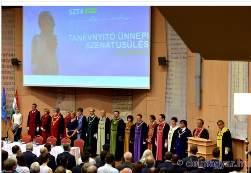
Képekben az SZTE tanévnyitó.