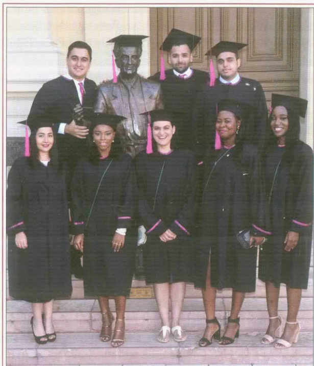
Angol nyelven tanult fiatalok és a Szent-Györgyi Albert szobor