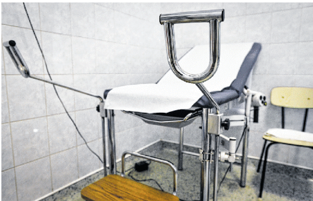
Abortuszt a terhesség 12. hetéig végezhetnek.

Abortuszt a terhesség 12. hetéig végezhetnek. Ekkor egy magzatnak már minden szerve kifejlődött, és felismerhető: van feje, keze és lába, illetve dobog a szíve. A vákuummal darabokban tudják kiszedni a magzatot, éppen ezért ez az orvosok számára is megterhelő lelkileg: vannak, akik nem is vállalják ennek elvégzését.