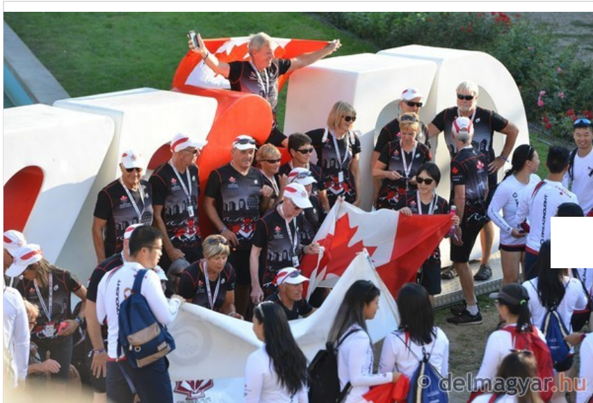
Megnyitották a sárkányhajó világbajnokságot - Galéria

A keddi és a szerdai programban 200 méteres futamokat rendeznek, csütörtökön és pénteken következnek az 500 méterek a Maty-éren, szombaton és vasárnap pedig a 2000 méteres számok – utóbbiak már a Tisza szegedi szakaszán.