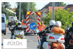
#ÚtOn ÚtON: Hosszú kocsisor áll az Algyői úton