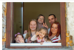
Három család kapott Makón bérlakást - nagy volt az...