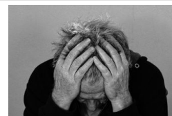
44 évig gyötörte a férfit a bűntudat, most könnyített a...