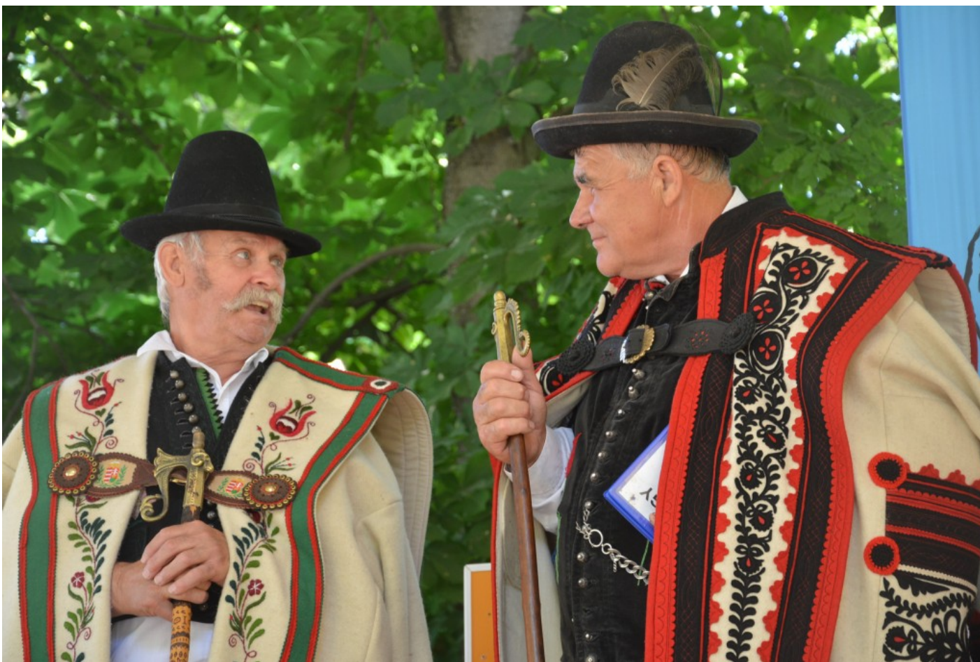
Juhászok egymás közt. Díszes ruhában.

A találkozóról az idén sem hiányzott a főzőverseny. De nem csak a finom pörköltök rotyogtak a titkos receptek alapján a kondérokban, de egy helyen nyársra tűzött birka forgott a faszén parázs fölött.