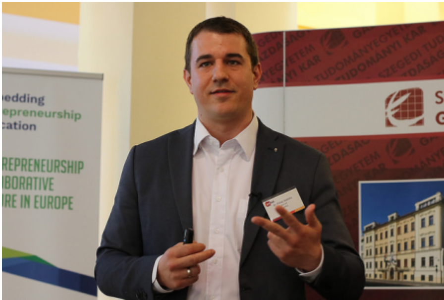
Képgaléria a rendezvényről.

( https://www.flickr.com/photos/143739712@N04/albums/72157696428079755 )