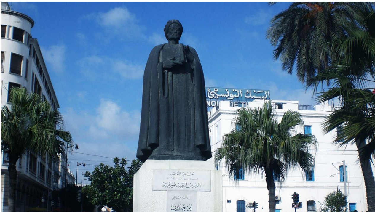
Ibn Khaldūn szobra Tuniszban

Azon sem kell csodálkozni, hogy akik továbbvándorolnak, Nyugat-Európába szeretnének eljutni (és nem hozzájuk), mivel ott 20–25 millió muszlim él. A németek 2015-ben egyoldalúan egymillió menekült befogadására tettek ígéretet. A menekülők élő kapcsolatot tartanak az ottaniakkal, tudják, hogy aki már letelepedett, az dolgozik és megél.