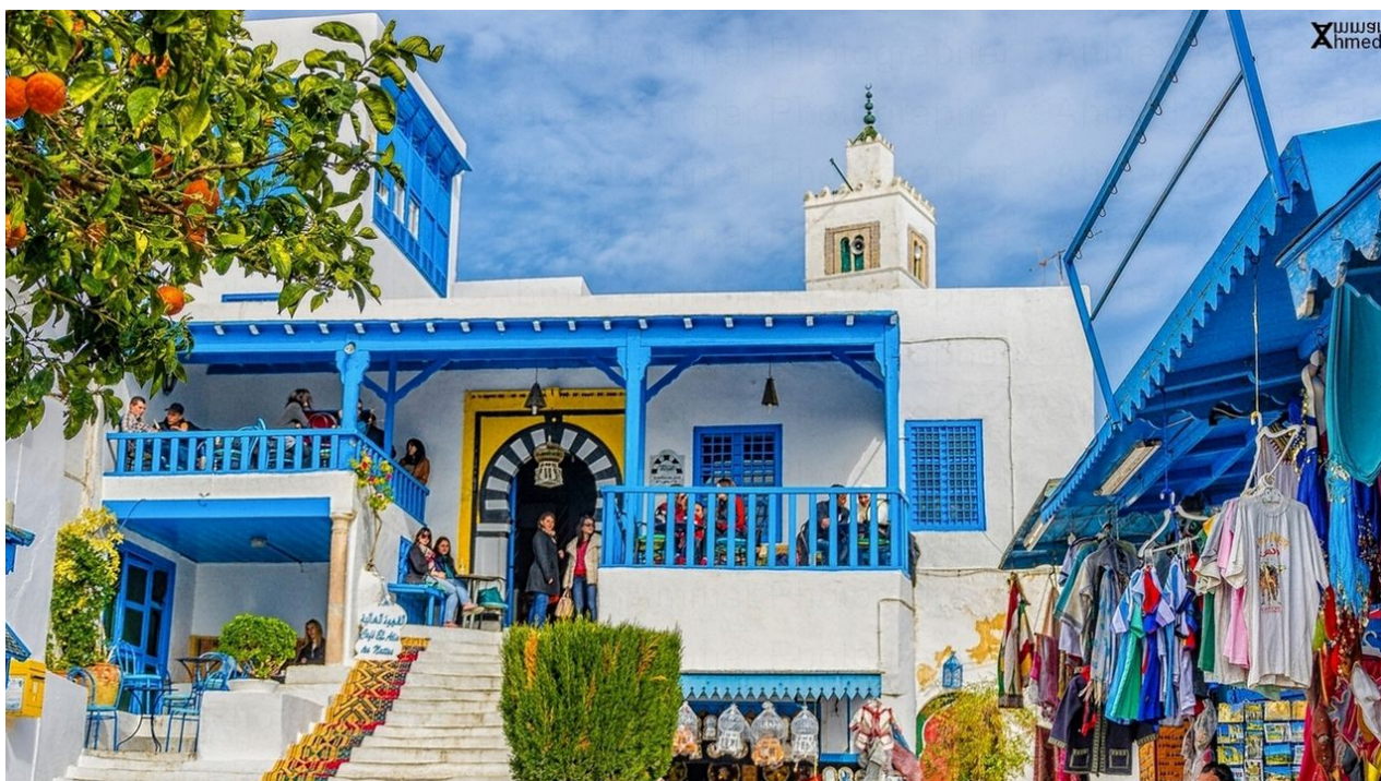
Híres kávézó Sidi Bou Saidban, Tunisz elővárosában, amely neves művészek kedvelt találkozóhelye. Paul Klee és André Gide is járt itt

– Az a véleményem, és ezzel egyáltalán nem vagyok egyedül, hagyni kellett volna és kellene az arab államokat békében. Nem különféle „nemes” szándékkal, valójában a kőolaj és a stratégiai pozíciók megszerzéséért beavatkozni, és megmondani, mi a demokrácia. Mert mit is akarnak ezek az országok az összes szélsőséges csoportjukkal együtt? A saját életüket élni modern formában, a sajátosságaikkal együtt. A modern forma alatt persze nem okvetlenül azt kell érteni, ami nálunk kialakult. Jólétre és nyugalomra vágnak, de nem hagyják őket.