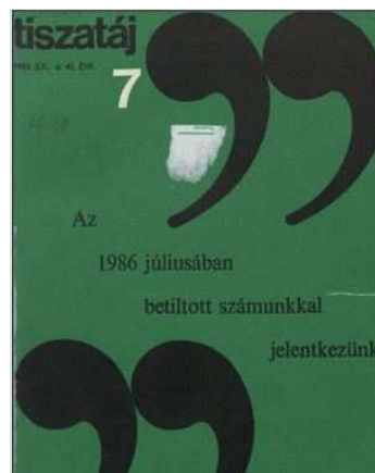
A rehabilitált Tiszatáj borítója 1989 júliusában.

A lap digitális archívumában megtalálható Gyuris György monográfiája , ami a Tiszatáj ötven éves történetét dolgozta fel (A Tiszatáj fél évszázada : 1947–1997. Szeged, Somogyi-könyvtár, 1997.).