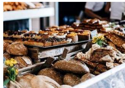
Közel ötmilliót sikkaszthatott egy boltvezető-helyettes Győrben