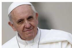
Szörnyű jövőtől tart Ferenc pápa