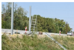
Picit csökkent a zaj Vajnáéknál