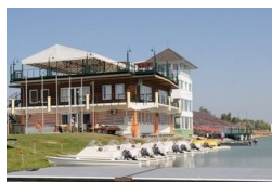
1,6 milliárdból újul meg a Maty-éri olimpiai központ