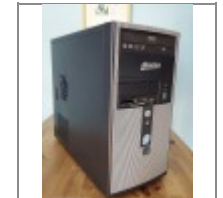
Használt számítógép (Core2Duo E4600, 2GB DDR2, 160GB HDD)