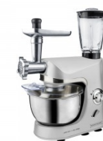
Royalty Line 3 az 1- ben konyhai robotgép RL-PKM1800BG SILVER