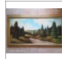
Telepy K. Antik festmény