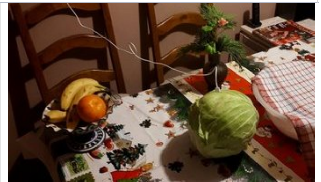
Töltött káposzta, ahogy még soha nem látta - fotók