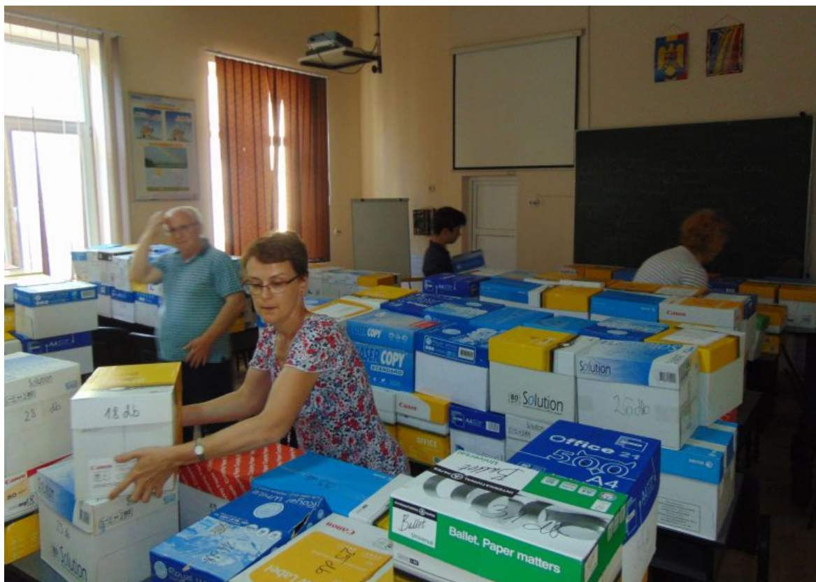
Két és fél tonna magyar nyelvű könyv gyűlt össze