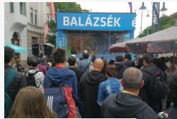
Szegedről szóltak Balázsék hattól tízig - fotók