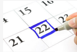
Ne mulassza el! Legkésőbb a pünkösdi hosszú hétvégén...