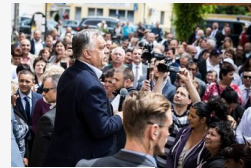
Orbán Viktor köszönetet mondott a falun élő embereknek