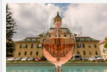
Borfesztivál programfüzet - így biztosan semmiről nem marad le!