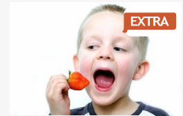
EXTRA Ötleteket mazsolázunk, hogy jobban egyen a gyerek - ...

CÍMOLDAL > SZEGED HÍREI > PÁLINKÁS JÓZSEF: A NÉMETEK IS TÁMOGATJÁK AZ ELI KIHASZNÁLÁSÁT