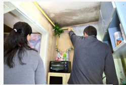
Fekete penész miatt költöznének - Féltik gyermekeik...