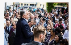
Orbán Viktor köszönetet mondott a falun élő embereknek