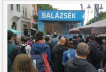
Szegedről szóltak Balázsék hattól tízig - fotók, videó