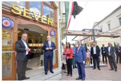
Török étterem nyílt a Kárász utcán