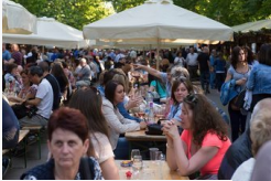
Kezdünk! Péntektől Szeged a világ közepe!