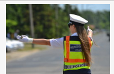
Mutassa meg Ön is, milyen jó KRESZ-ből: játsszon a Délmagyarország és a CSMRFK nyereményeiért!