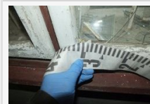
Részeg nő dühöngött Szentesen: négy családi ház ablakát törte be ököllel