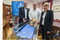
Bölcsőt kapott a nőgyógyászati klinika