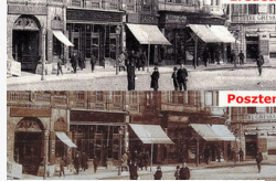
Lekerül a történelmet meghamisító kolozsvári...