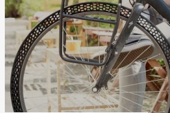
Feltalálták a levegő nélküli bicikligumit - Videó