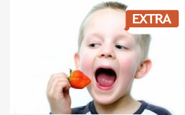
EXTRA Ötleteket mazsolázunk, hogy jobban egyen a gyerek - ...

CÍMOLDAL > SZEGED HÍREI > NEM ÁLLTAK MEG TÖRÖK MÁRK VÁDJAI