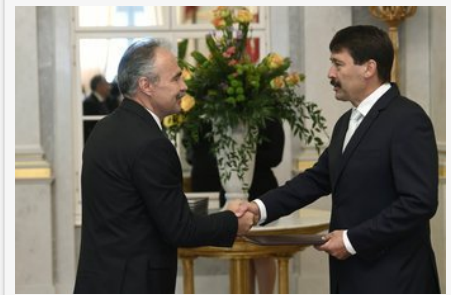
Megalakult a negyedik Orbán-kormány