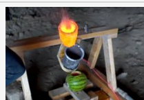
Nézzé meg milyen, amikor izzó sötöntenek egy