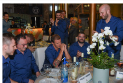
Idényt zárt a MOL-Pick Szeged - galéria