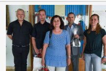
Több mint ezren tesztelték tudásukat KRESZ-játékunkon -