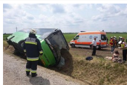
Szeged-Győr közötti járat borult árokba a 62-es úton...