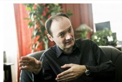
Fenyő-gyilkosság - Elfogultsági kérelmet és kizárási...