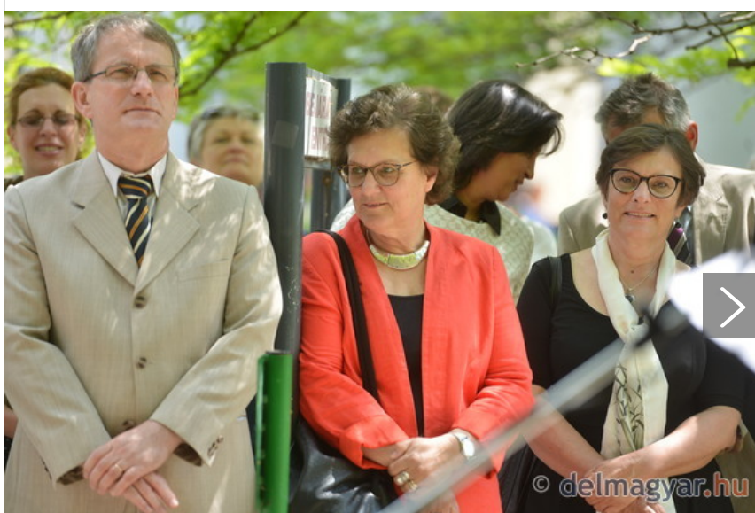
Felavatták a Göncz Árpád sétányt Szegeden - GALÉRIA.

– Szólintsál csak Árpi bácsinak! – mesélt Szőnyi György Endre a megismerkedésükről, amikor a professzor még fiatal tanársegéd volt az angol tanszéken a nyolcvanas évek végén Szegeden. Göncz Árpád fordította le A Gyűrűk Urát, és Szőnyi szerint Göncz Árpád szellemében Bilbó, bölcsességében pedig Gandalf volt, majd köztársasági elnökké választották – és lett mindenki Árpi bácsija.