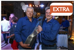
EXTRA Doki és Ivu, a két triplázó