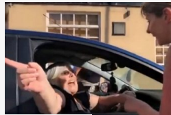
Behajtott a futóversenyre kocsival, és még neki állt...