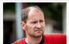
Gyerekgyilkosság Sólyon: Minden pillanat fullasztó a lányom nélkül