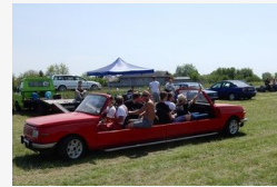
Egyszerre jön és megy a csongrádi Wartburg - fotók