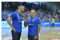
Pastor és Krivokapics is szerződést hosszabbított a...