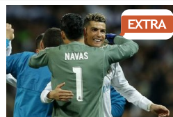
EXTRA Triplázhat a Real Madrid, Klopp szerint a Liverpoolban...

CÍMOLDAL > SZEGED HÍREI > LÁZÁR: A SZEGEDI EGYETEM ÉLETÉT HOGYAN BEFOLYÁSOLJA A KÜLFÖLDI EGYETEMEK EGYSÉGES SZABÁLYOZÁSA?