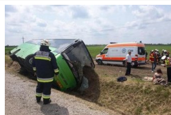
"Véres volt a sofőr arca" - Nyilatkozott a Szegedről...