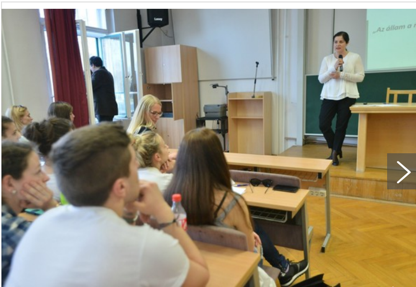
Tömegesen jelentkeznek a leendő védőnők és ápolók.