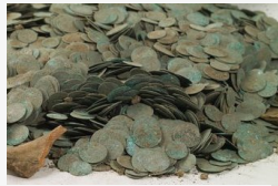
Szenzációs pénzeletre bukkantak Kunmadarason - Galéria