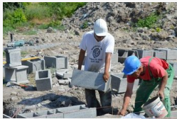
Az önkormányzati bérlakásokra 180 milliót költenek -...