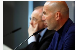
Mindent megnyert közel 3 év alatt, mégis távozik...