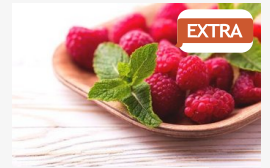
EXTRA Receptár: málnamánia

CÍMOLDAL > SZEGED HÍREI > TÖBB MILLIÓAN NÉZTÉK A KÍNAI TÉVÉBEN, SZEGEDET NÉPSZERŰSÍTETTE