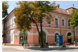
Megmenekült a csődtől Csanádpalota