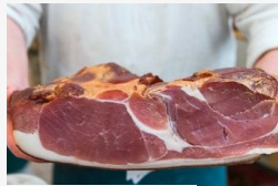
Mutatjuk, miről ismerheti fel a jó húsvéti sonkát