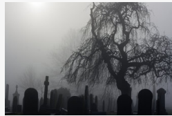
Sokkoló látvány fogadja az egyik braziliai temetőbe...