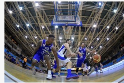
Kiénekeltek a sajtót a szájukból:...