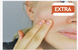
EXTRA Belefáradnak az erek a pirulásba: gyógyíthatatlan...

CÍMOLDAL > SEGÍTSÉG > EGY TANÁR A TANÍTVÁNYAIRA A LEGBÜSZKÉBB