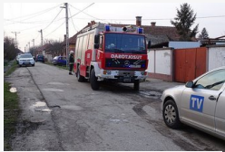
Felrobbant egy tűzhely Csongrádon