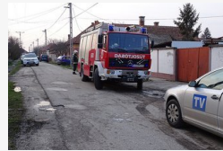
Felrobbant egy tűzhely Csongrádon