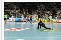
Összeomlottak a második féldőre: THW Kiel-MOL-PICK Szeged 29-22