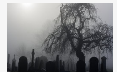
Sokkoló látvány fogadja az egyik braziliai temetőbe látogatókat - videó