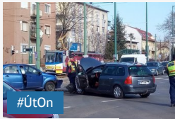
ÚTON: két autó ütközött a Római körúton - galéria