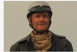
Bud Spencer emlékére készített filmet Terence Hill - Itt...