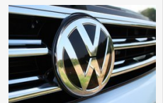
Kínos incidens robbant ki a Volkswagennél