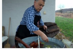
Orbán Viktor sonkát főz - videó