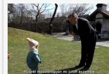
Így locsolkodott Orbán Viktor