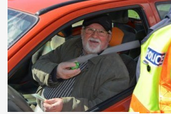
Rendhagyó közötti ellenőrzés: csokitoját osztogattak a...