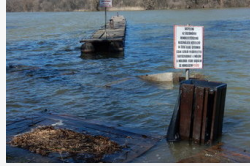
Majdnem a járdáig ér a víz a mártélyi strandon - galéria