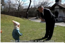
Így locsolkodott Orbán Viktor