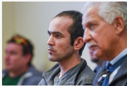
Öt évre ítélték a magyar rendőrökre fegyverrel támadó...