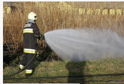
Meglazultak a templomtorony cserepei, 2000...