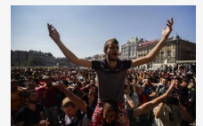
Bevándorlók betelepítését támogatná a Jobbik politikus