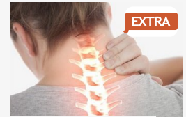
EXTRA Sérvkezelés tornával - Vizsgáltassuk meg, ha túl sokat...

CÍMOLDAL > SEGED HÍREI > TÁRSADALMI KAMPÁNY A DÉLMAGYARORSZÁGGAL: CSEKKEN IS ADAKOZHAT A STROKE-BETEGEKNEK