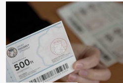
Most az esés, decemberben a beszélgetés okozott...