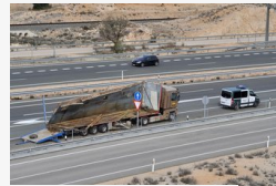
Elefántokat szállító kamion borult fel - fotók, videó